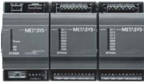
XT-9100 通讯模块及 XP-910x 扩展模块